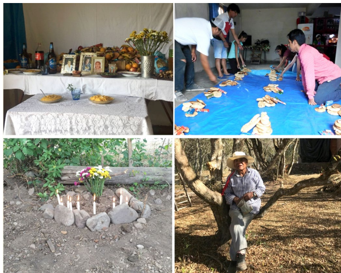
Figura 5 Rituales para las almas y los cerros